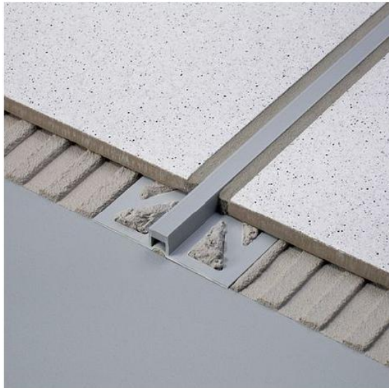
Esodal PC/L (embase larges perforées)