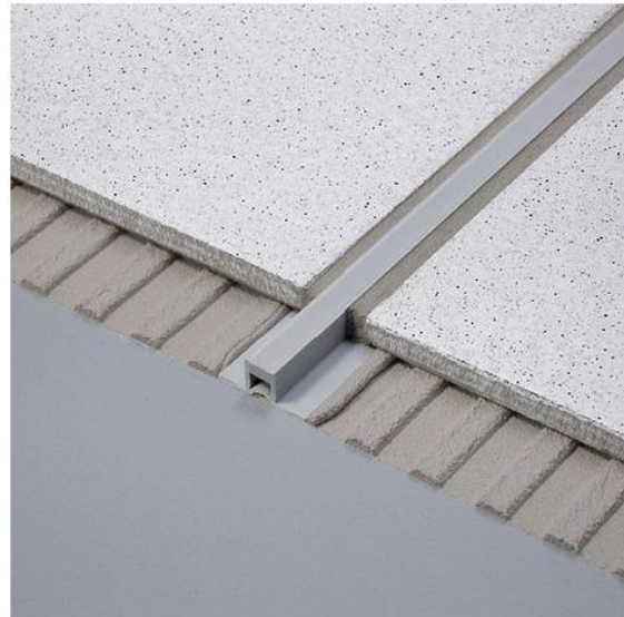
Esodal PC (embase étroite)