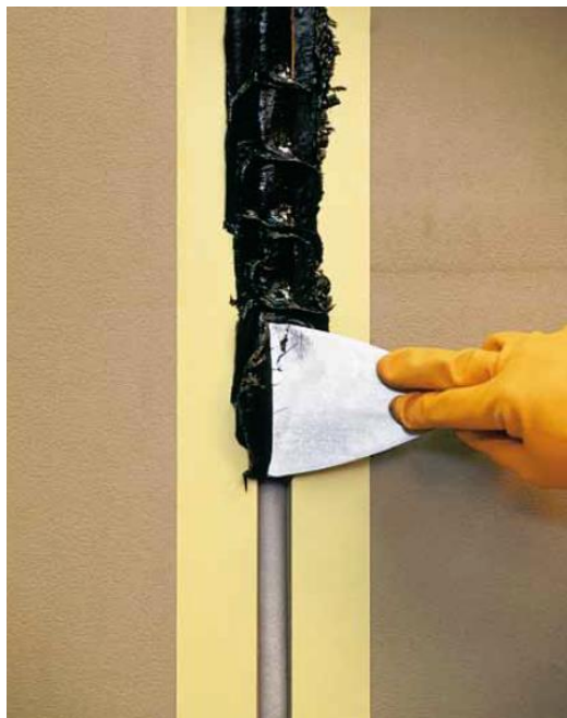
Application verticale de l'Esouflex Pub HR 25 thixotrope