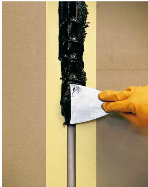
Application verticale de l'Esosflex Pub HR 25 thixotrope